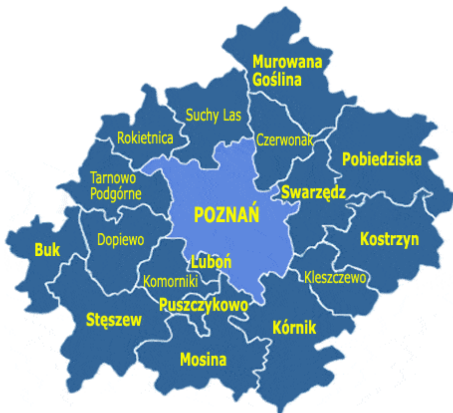
Rysunek 3 Położenie Gminy Stęszew na tle Powiatu Poznańskiego