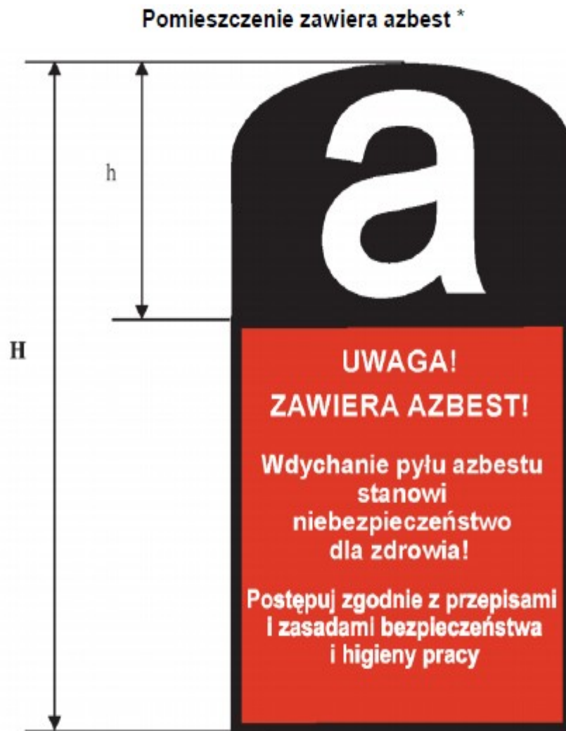
Rysunek 1 Graficzny wzór oznakowania azbestu i wyrobów zawierających azbest